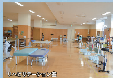
リハビリテーション室