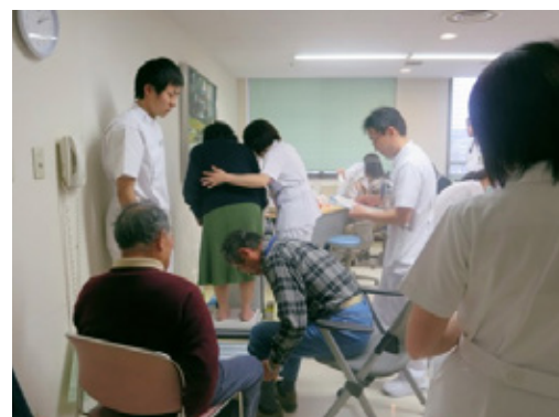
肺機能検査・医師の相談も無料で行いました

COPD啓蒙のためのパンフレットや肺の健康チェックシート等は、「仙台COPDの会」ホームページからダウンロードできます。患者様の診療にご活用ください。