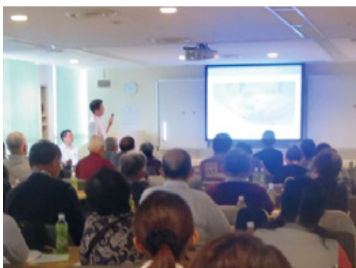
専門の呼吸器科医師、看護師、薬剤師、理学・作業療法士による講演