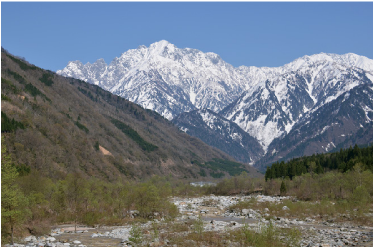
剣岳・剣御前遠望